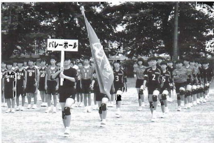
令和2年 部活動パレード