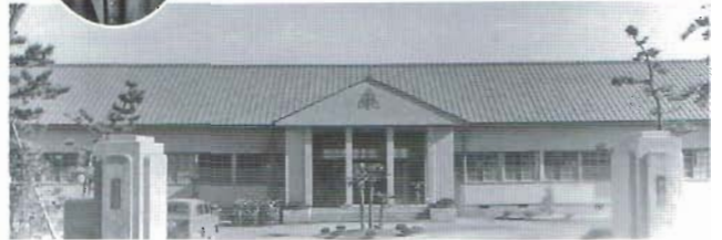
日立市多賀中学校