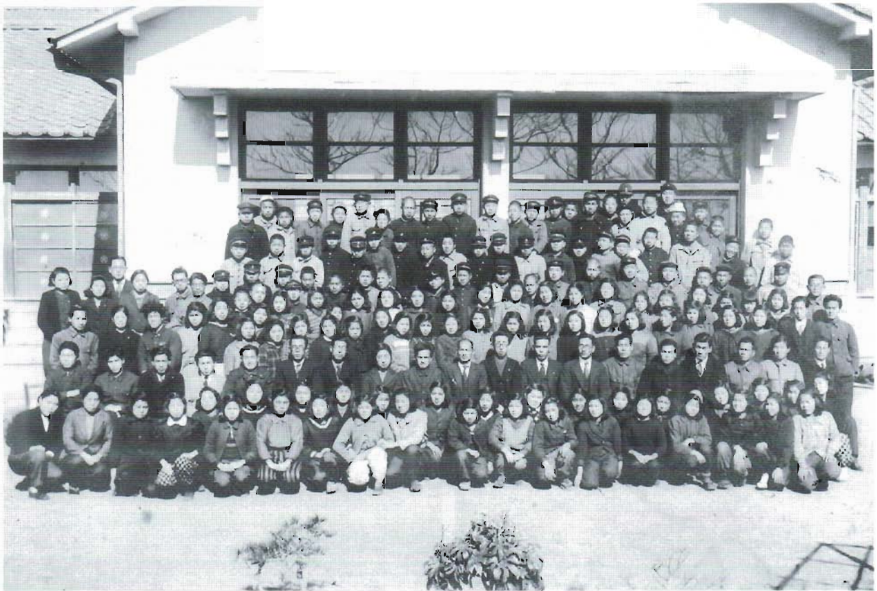
昭和23年3月 第一回卒業生

5つの分教場（水木、大沼、河原子、成沢、大久保の各小学校） で学んでいた生徒たちが一堂に会し、多賀中生となる。