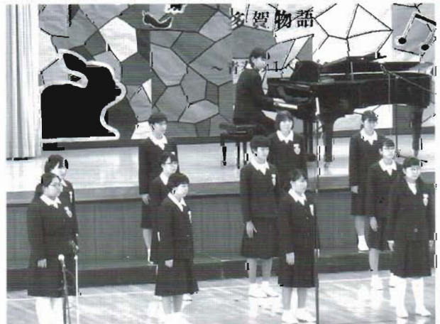
令和2年 合唱コンクール