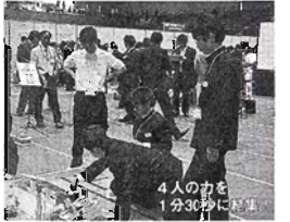
中学生ロボコン 11/30! 関東甲信越大会(新潟)出場 選択技術3年生チーム4名が2台のロボットを設計・製作・操縦。テニスボールと空き缶を、時間内に多く、自分の陣地に運んだ方が勝利。もちろん、相手陣地から取り出してしまうのがOK!

体育祭 9/5!→ 「FULL POWER」 ～勝利の道を駆け抜けろ～ をスローガンに学年クラス対抗。女子ムカデ競争、男子人間機関車、3年男子夏男バンザイ、3年女子へんし〜ん、等々。一見の価値あり!来年は応援に来て、どんな銅板が確かめて。