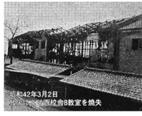
昭和42年3月2日 茨城県東陵より学校8教室を焼失 写②

(後にグラウンドの隅に土俵も作られ、今までに大相撲の関取を四人も誕生させた中学は全国でも稀なことです。) また、生徒会役員が中心になって、大人達の選挙の棄権防止に「皆さん投票に行きましょ!!」と自転車でもメガホン片手に連呼したことも等々、今では考えられない活動も代わりましたが生き生きとした中学生生活でした。 私も充実した多賀中時代を過ごして、大人達の選挙の棄権防止に「皆さん投票に行きましょ!!」と自転車でもメガホン片手に連呼したことも等々、今では考えられない活動も代わりましたが生き生きとした中学生生活でした。 また、同じ学校で学んだ仲間も「校友」として、いつまでも校友であり貴重な存在であることも経験し感謝しております。 また、同じ学校で学んだ仲間も「校友」として、いつまでも校友であり貴重な存在であることも経験し感謝しております。 また、同じ学校で学んだ仲間も「校友」として、いつまでも校友であり貴重な存在であることも経験し感謝しております。