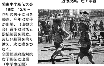
関東中学駅伝大会 19位 12/6→ 昨年の男子に引き継ぎ、今年は女子が出場。(山梨大会)選手は部活と駅伝練習を両立。苦しい練習を乗り越え、次に勝つべく、全国都道府県対抗女子駅伝に出場(中学生区間)