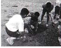
一学年心ゆたかな体験学習 6/18・19 西山研修所 原子力資料館見学と河原子海岸で砂の造形 やっと慣れた中学校。さらに自覚と運動感を高めよう!