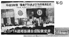
平成9年度 優良PTAおよび功労者表彰式 写⑤