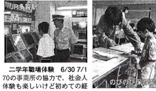
二年生職場体験 6/30/7/1 70の事業所の協力で、社会人体験も楽しいけど初めての経験に身も心も疲労のピーク。大人は大変だなあ…