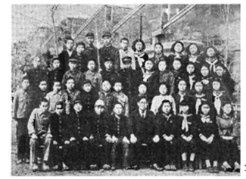
昭和23～28年のこぎり校舎をバックに卒業写真 写①