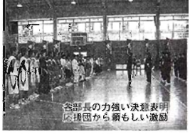
市内・県北・県総体1 市内総合第2位 男子テニス 都関東大会出場 受け継がれている「多賀中魂」は健在! 秋の新人戦も市内総合2位をキープ。 これからの活躍が益々楽しみ!